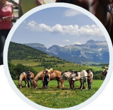
Cavaliers propriétaires acceptés

Participez au pèlerinage équestre qui nous emmène des lacs jusqu'aux alpages de Notre Dame de la Salette. Une expérience inoubliable et conviviale, empreinte de traditions ancestrales (et sans obligation de culte)