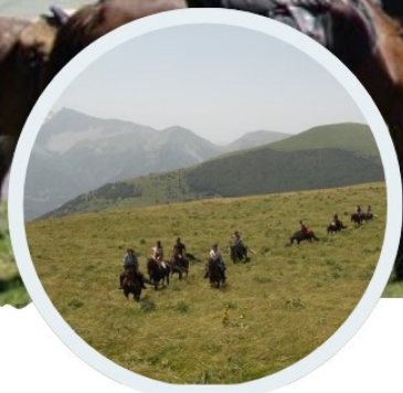
Alpages et lac