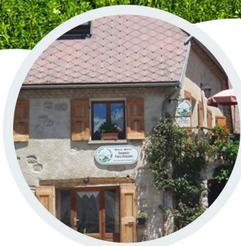
Herbergement en Gîte Pension complète