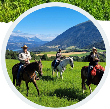
Petit groupe assuré