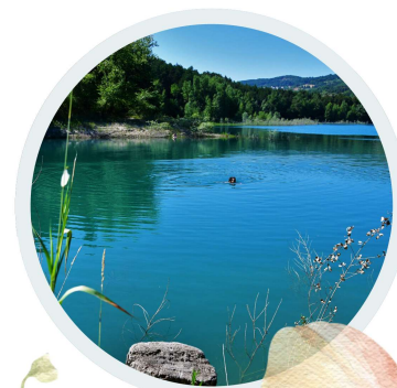
Baignades et pauses fraîcheur